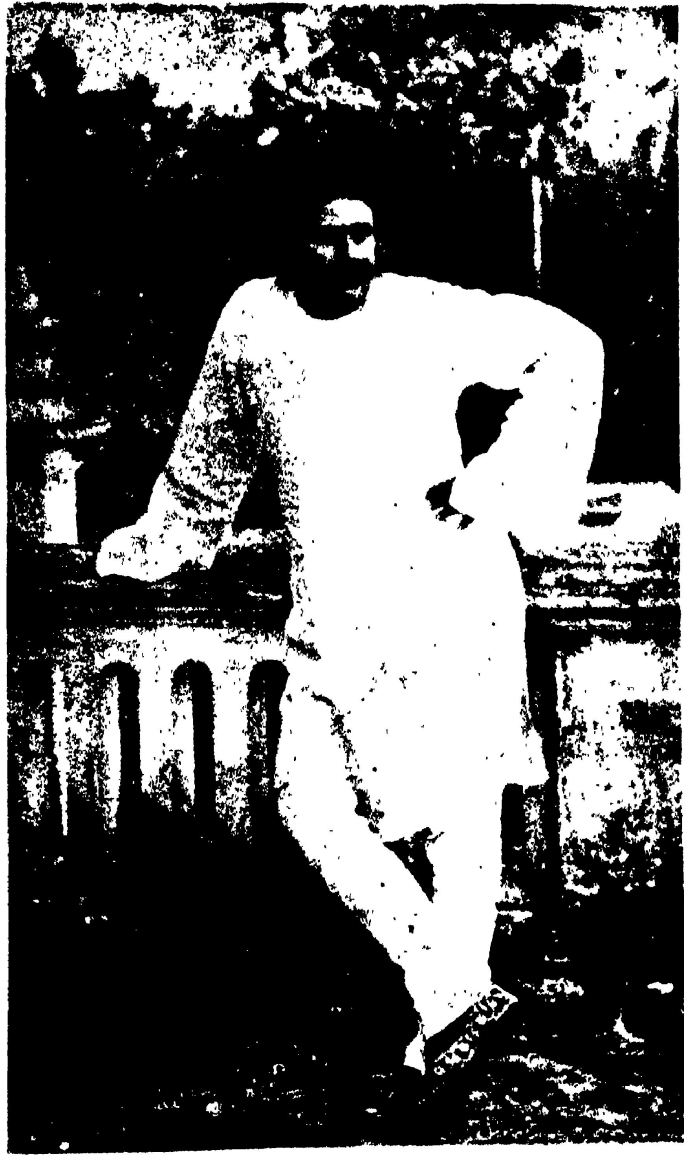
కృష్ణాచార్య — "ఆంధ్రప్రదేశ్ లోని కృష్ణానది తీరమున ఉన్న కృష్ణాచార్య వారి వ్రాసిన గ్రంథములు" అని పేరు పెట్టిన గ్రంథములు

శ్రీ కృష్ణాచార్య వారి వ్రాసిన గ్రంథములు — కృష్ణాచార్య వారి వ్రాసిన గ్రంథములు