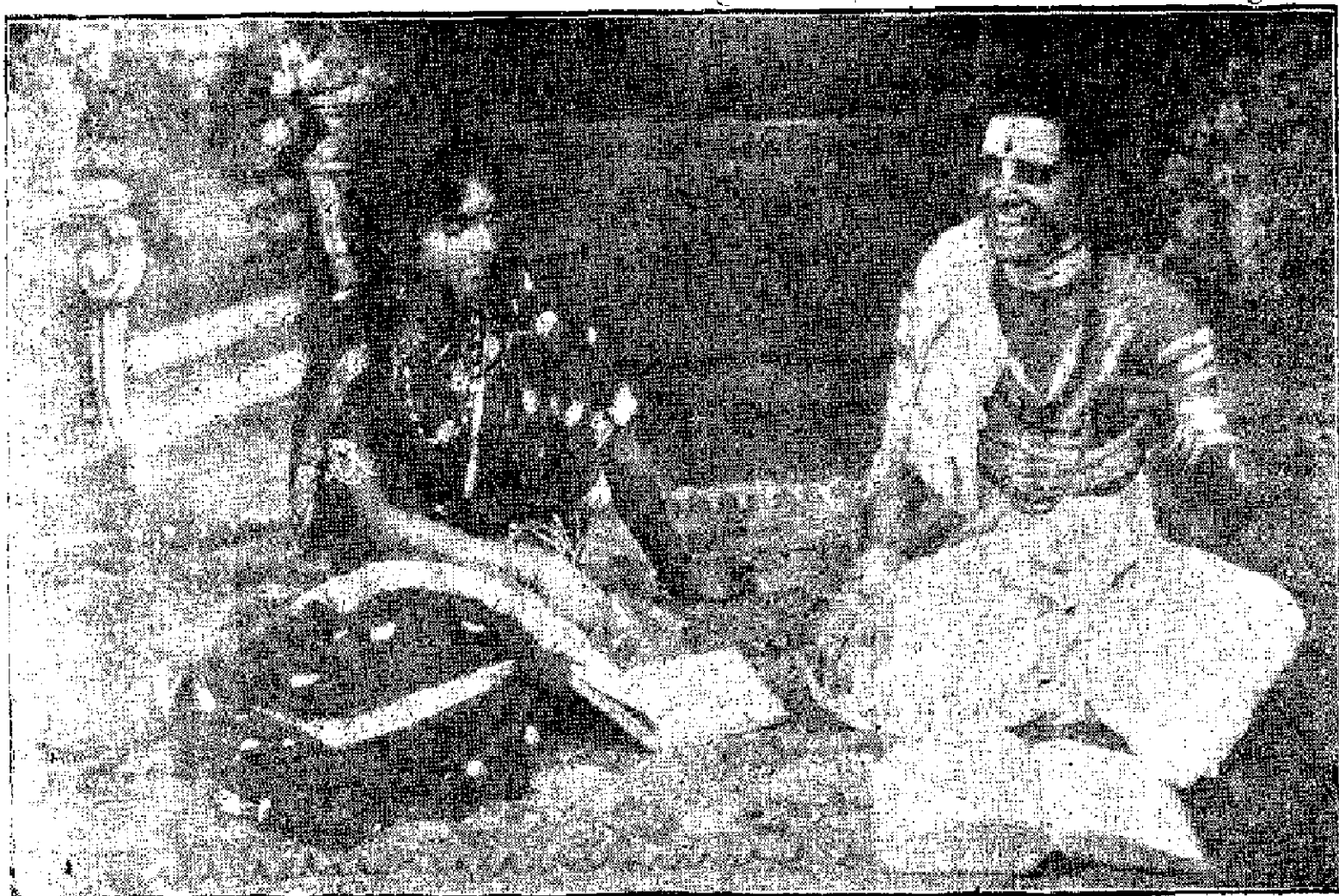
కాస్త్రీ : క న క మ్మ.

కొంచెం చేర్చి స్తేనేకాని నాటకం రక్తికట్టదనే యుద్దేశంచేత కాబోలు భక్తిలో హాస్యరసాన్ని మేళవించారు. మేళవించడంలోకూడా మిక్కిలి నేర్పరితనంచూపించారు. తీర్థానికి తీర్థము ప్రసాదానికి ప్రసాదము కాకుండా అంతర్నాటకం అసలు నాటకంలో మిళితమయింది.