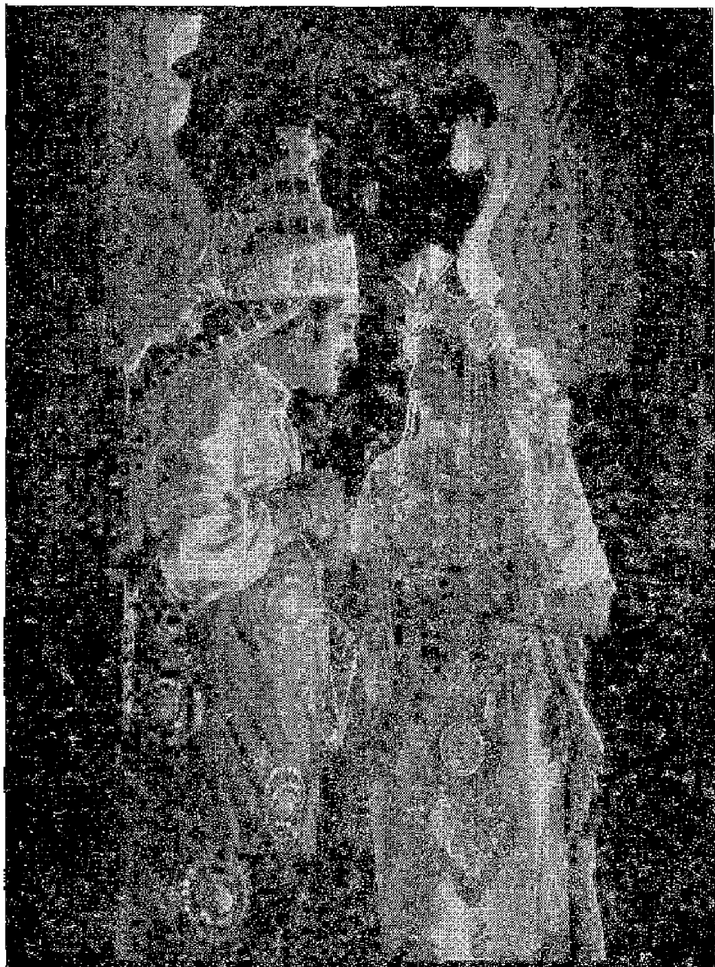
'కింగు ఫర్ ఎ జే' అను ఫిలింలాంటి ఒక దృశ్యము.