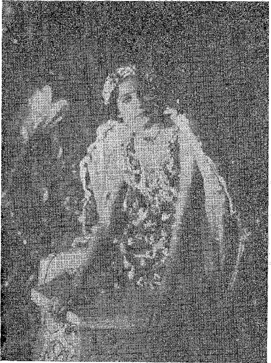
ఈస్టిండియా ఫిలింకంపెనీవారి 'ఇంద్రసభ' లోని ఒకనటి.