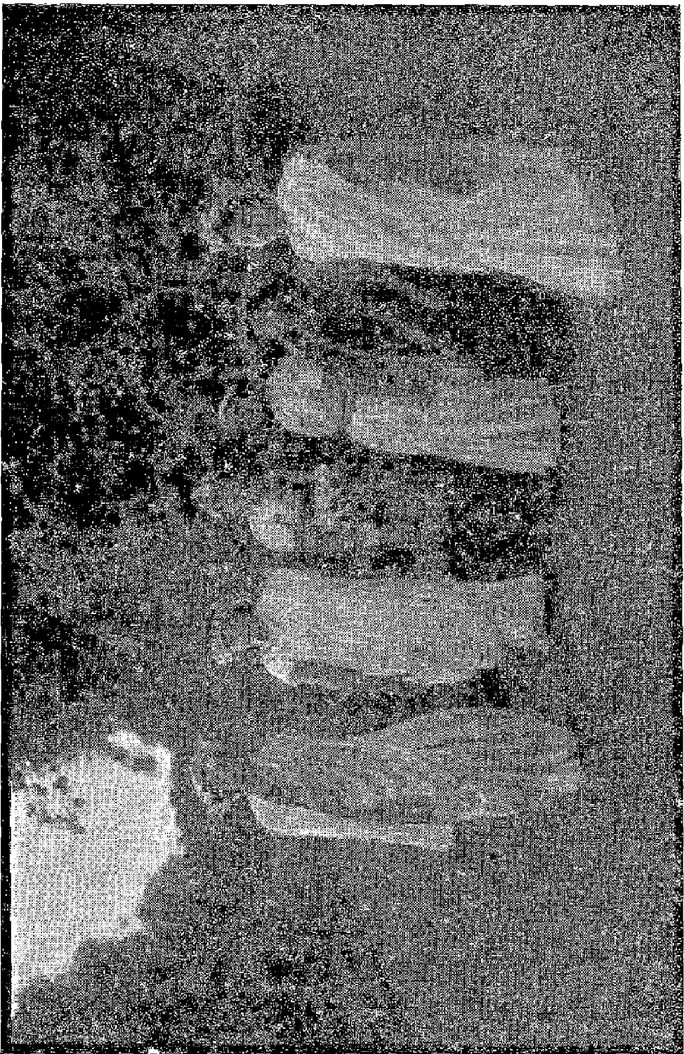
‘సలదమగలకుంత్రి’ అను ఫిలిములొకొ చనుంకుంత్రి వనవిహళకము.