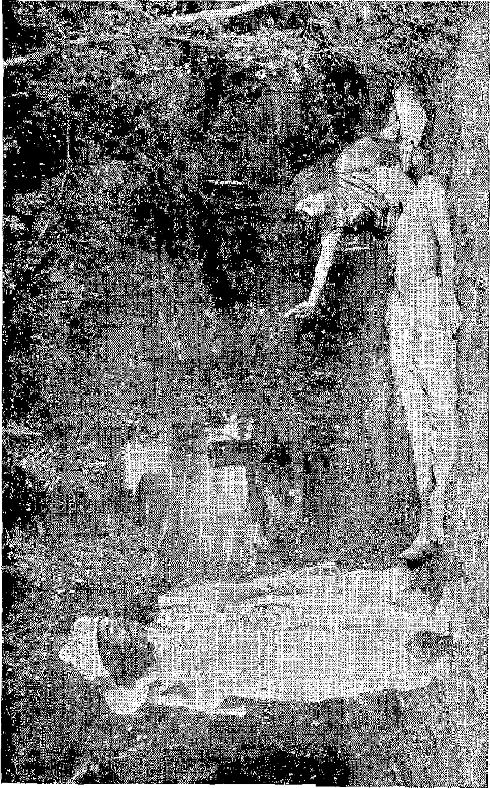
ఈ స్థలమునా ఫిలింకంపెనీవారి 'సావిత్రి' లోని ఒక దృశ్యము