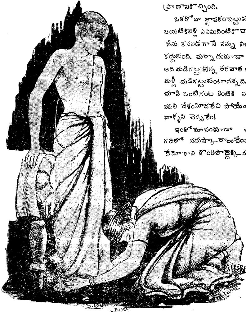
S. P. V. K. R. A.

దీనితోనే నాకు దా న్నిమాస్తే హడలయిపో తే, ఇదిచాలక పూర్వం చేసుకునే యోకులన్నీమా నేసి ఖుట్టు గోళ్ళతోనే ధువ్వి కొట్టాపెట్టుతుంది,